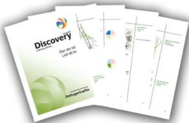
T1117 - Styr din tid - Led dit liv