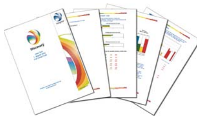
Insights Full Circle 360 grader om adfærd og kompetencer