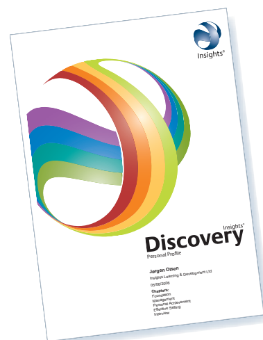
Insights Discovery Preference Flow