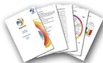
Insights Discovery Personprofil 10 sider om salgseffektivitet 6 faser og 24 essentielle områder i salget

Dag 2 - Facilitering i Insights Salgseffektivitet Med udgangspunkt i materialerne bliver du på denne dag indført og afprøvet i rollen som salgssfacilitator. Dagen igennem bringes koncepterne til live via vores principper for accelereret læring. Alle har rig mulighed for at interagere med hinanden, samt stille spørgsmål vedrørende deres egen brug af Insights koncepterne.